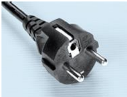
EURO plug 220-240 volt