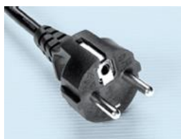
EURO prise 220-240 volts