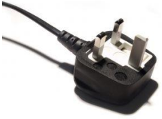
UK plug 220-240 volt

Before using, check your plug to make sure it is the proper voltage for your country.