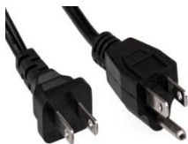
USA bouchon 110-120 peut également être utilisé au Japon.