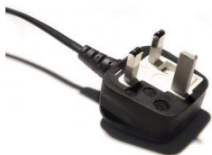
Prise UK 220-240 volts

Avant utilisation, vérifier votre fiche pour s'assurer qu'il est la tension appropriée pour votre pays.